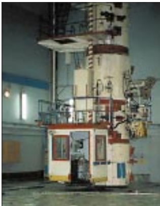
Ignalinos AE reaktoriaus salėje.

Misija iš esmės teigiamai įvertino VATESI veiklą, tačiau primygtinai rekomendavo Inspekciją stiprinti.